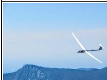
das Segel- Flugzeug